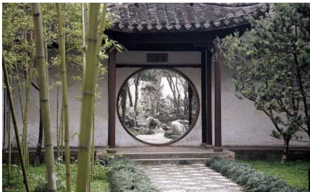
Elementi kitajskega vrta – skale, voda, lunina vrata, zid, bambus, bor