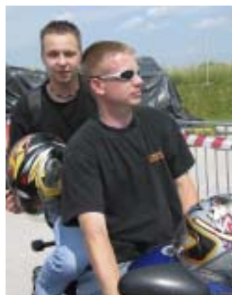
Po frizuri jim sicer ne bi pripadil pripadnosti slovenjegraškim Apacijem.

V četrtek, 29. maja, so pričeli postavljati prizorišče, ki je bilo pravočasno pripravljeno, da je sprejelo v petek prispele prve bajkerje. Že ta dan je bil izpeljan v celoti zastavljen program z rock skupinami Mašine, You Too, On/Off in erotičnim programom, v izvedbi prikupne Štajerke. Generalka je uspela in Pantherji so malo lažjega srca pričakali sobotni naval motoristov iz vse Slovenije, Madžarske, Hrvaške, Avstrije in Nemčije. Od najdlje so se pripeljali motoristi iz Hamburga, najštevilčnejši pa so bili Apachi iz Slovenj Gradca. Panoramska vožnja po mestu je bila izvedena na vzoren način in je pritegnila vsesplošno pozornost, tudi celjske TV, ki je o prireditvi pripravila poseben prispevek v okviru svojega programa. Med vožnjo sta bila dva postanka, po povratku na prizorišče pa so se pričele družabne igre, katerih se je udeležilo veliko število prisotnih. V glasbenem delu prireditve so nastopile skupine XXX BAND, METAL STILL in na koncu, po obsežnem erotičnem programu, ki je bil prilagojen ženski in moški publiki, še AMBASADA.