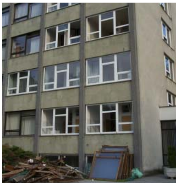
Vstavili so nova okna, mestna hiša je kot nova!