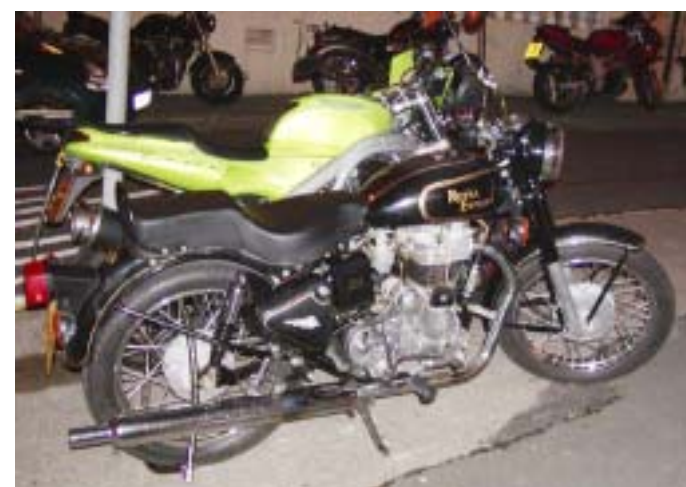
Njegova leta mu ne branijo udeležbe v nočnem življenju.