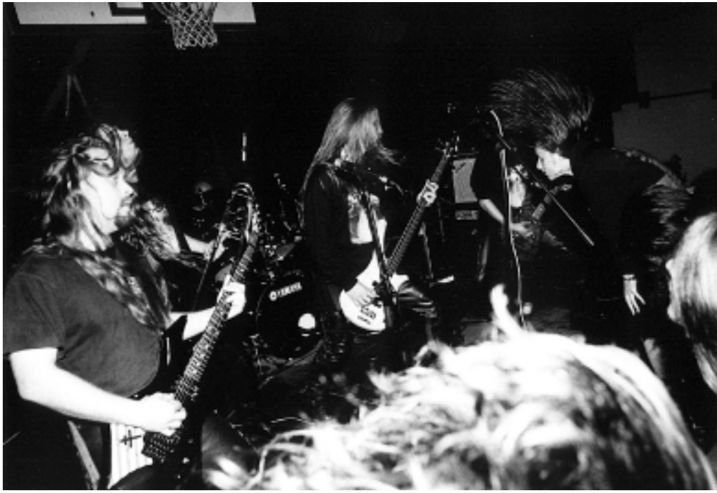
SEAR BLISS, Iverčko jezero