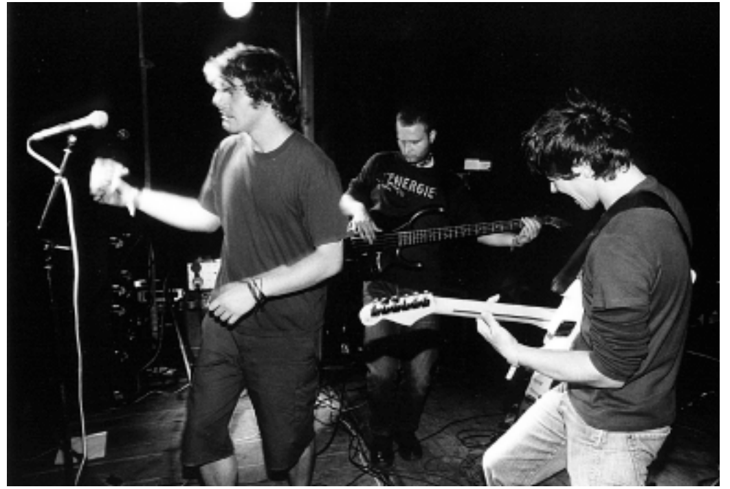
DRY FISH, Iverčko jezero