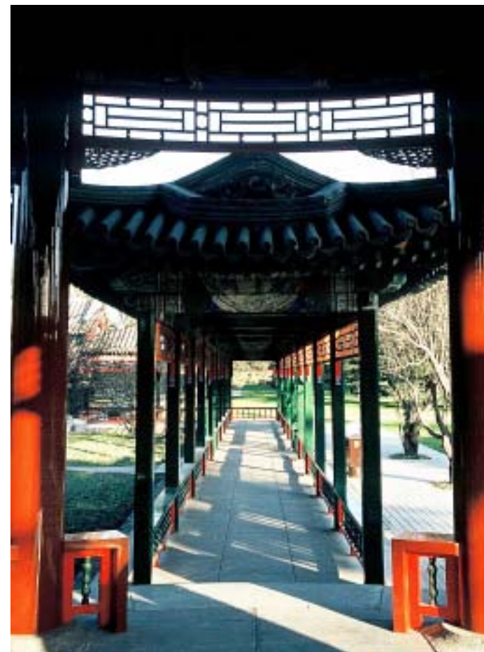
Pokriti hodniki z bogato ornamentiko

(nadaljevanje v prihodnji številki Populista)