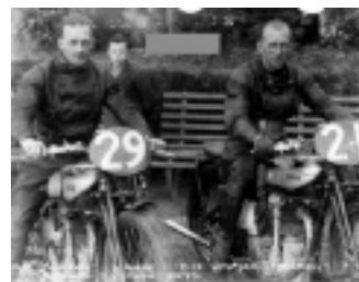
Še par Nortonov iz kasnejših let, točneje 1932