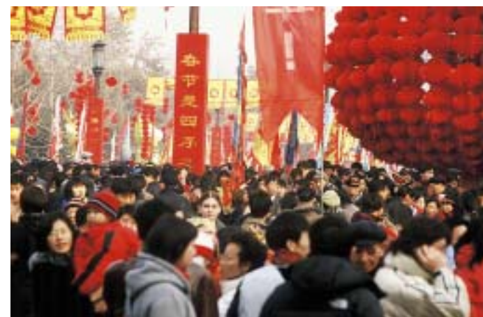
Množice Kitajcev na novega leta dan