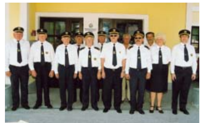
Skupina članov ZŠAM Velenje ob letošnji akciji »Varno iz šole na počitnice«