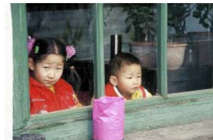
Na predvečer novega leta se družine zberejo po domovih