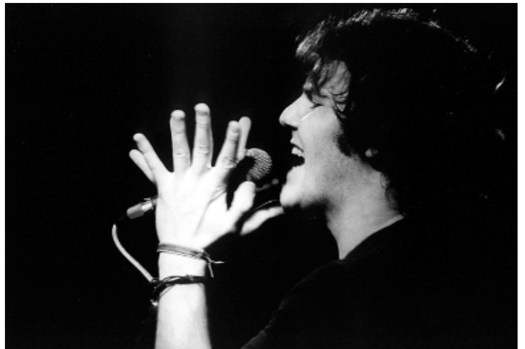
DRY FISH, Iverčko jezero