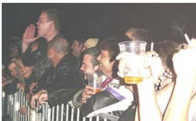
Pred odrom na katerem poteka erotični program