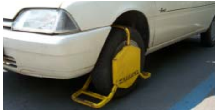
Lisica zgrabi, spusti pa le za 15 jurjev in stroške odvoza!

Ne zaradi stekline, ki jo prenašajo lisice (Le ta se je v zadnjih treh letih precej unesla). Ne! Ampak zaradi nove akcije komunalne uprave mestne občine Velenje in zaradi Novega vira prihodkov v občinsko blagajno (poleg zagotavljanja prometnega reda), se Velenjčanom že tresejo kratke hlače. Lisice bodo zgrabile še bolj, kot dosedanja občinska nadzorniki za promet in komunalni red. Zgrabile bodo za kolesa narobe parkiranih vozil in nova komunalna vojna se bo pričela. Le še vroče poletje nas loči do