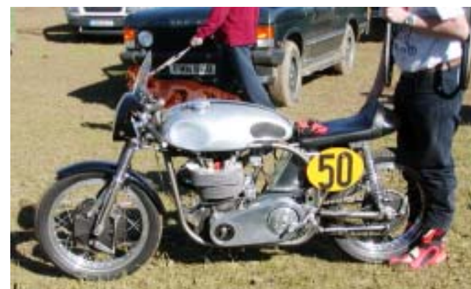
Mnogo motorjev iz tistega časa je ohranjenih v muzeju motociklov na samem otoku.