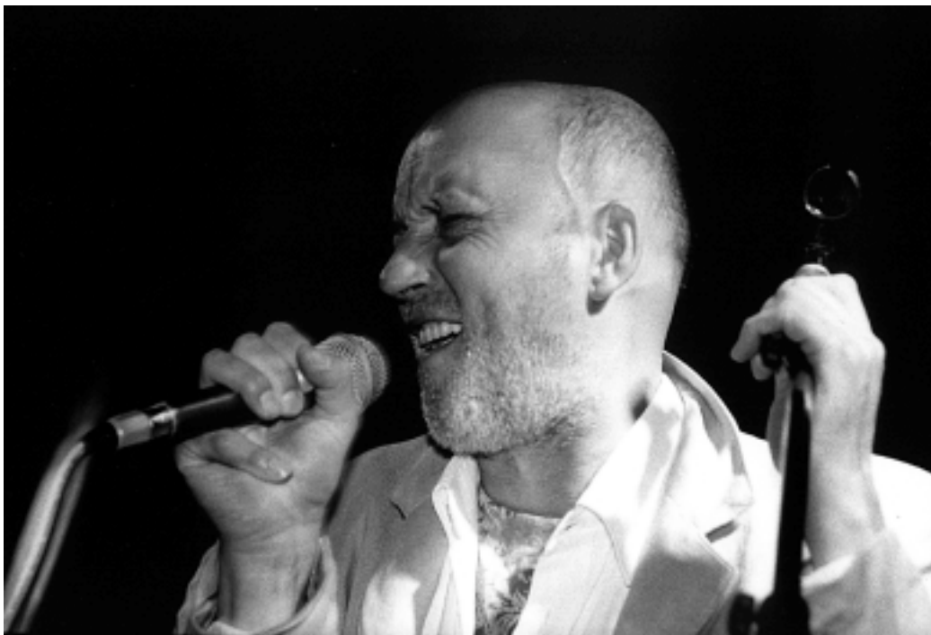
VLADO KRESLIN, Iverčko jezero