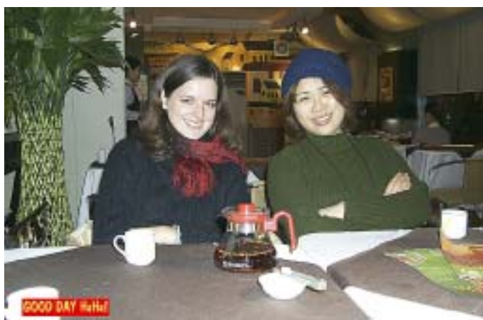
Kako smo si različni