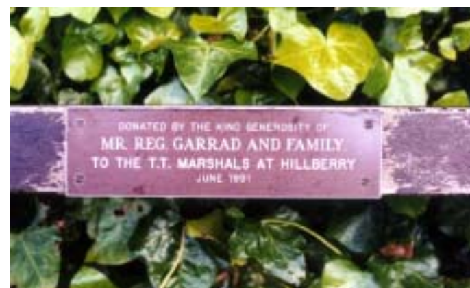
Vsaka klopca ob TT Course - dirkalni progi nosi takšno ploščico v znamenje hvaležnosti tistemu, ki je omogočil njeno postavitev. Večino stranskih del, ki so omogočila dirke, je bilo narejenih prostovoljno in na stroške prebivalcev.