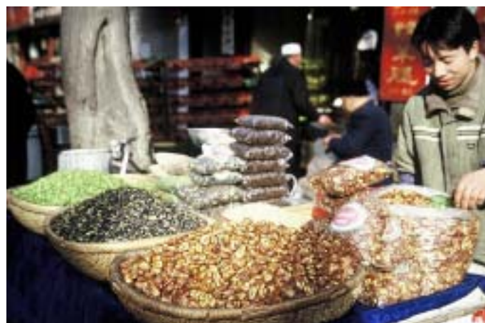
Novoletna kulinarčna ponudba