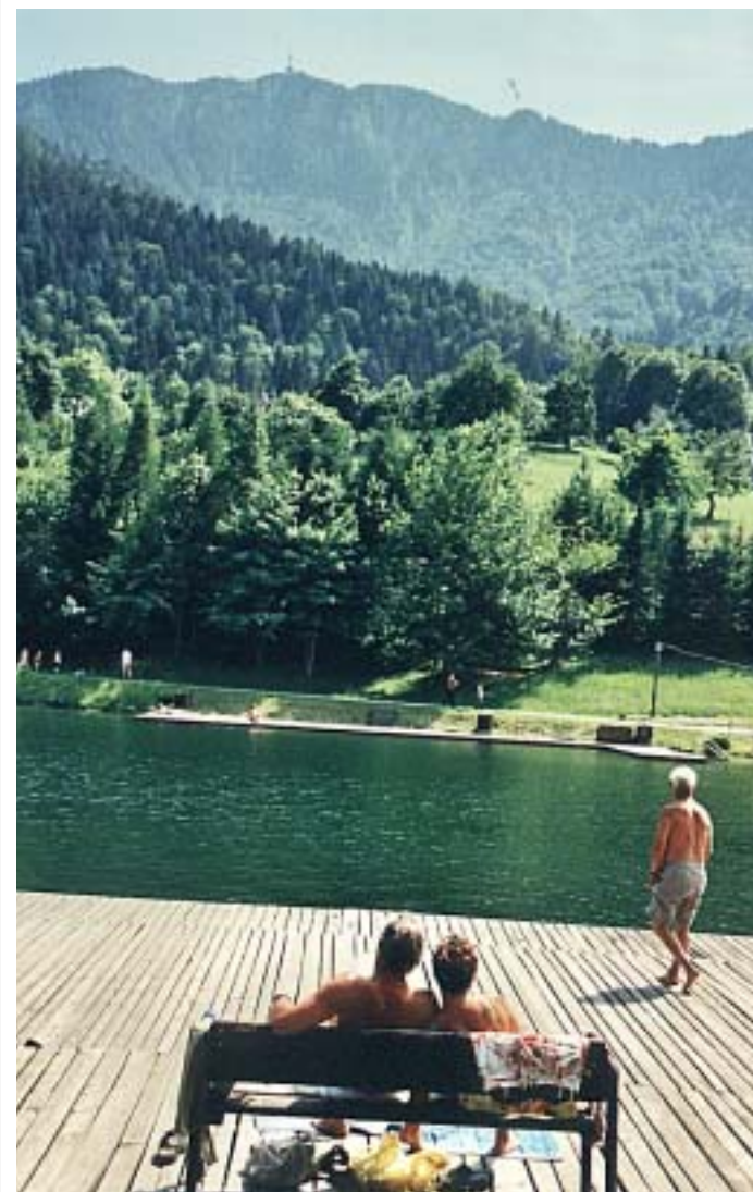
Bodo v Velenju zmogli to, kar so na Ravnah na Koroškem?

Ko smo malo preverili pri pristojnih, kako daleč so s projekti, smo ugotovili, da bazen v dolgoročnem načrtu je. Vsebuje ga projekt, ki gradi rekreacijski center na jezeru; izgradnja tega centra je še v izdelavi in kot nadgradnjo naj bi čez nekaj let izgradili tudi bazen. Lokacija bo levo od bele dvorane in bazen naj bi ustrezal vsem zahtevam kopalcem. Ne glede na to, da imamo Velenjčani v svoji okolici kar nekaj možnosti koriščenja kopalnih uslug, prebivalci menijo, da moramo dobiti bazen v mesto.