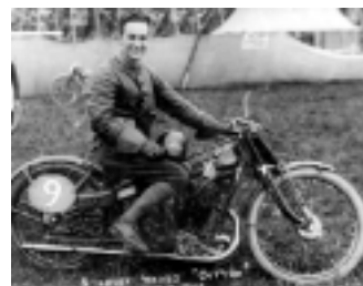
Legenda Stanley Woods s svojim Nortonom, leta 1923