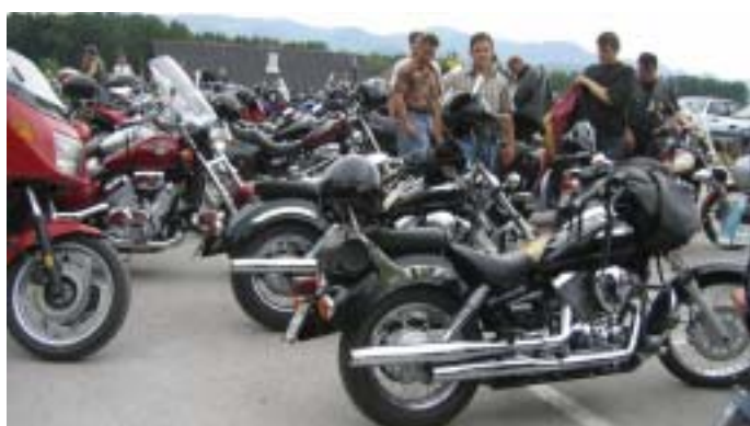
Kadar je na kupu veliko tega železja, je dosti tudi radovednežev.