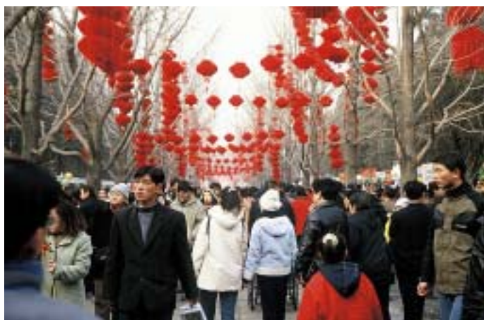
Sprehajanje po novoletno okrašenih ulicah