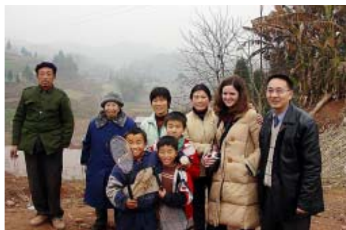
Kitajska družina na podeželju