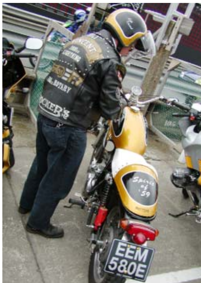
Nekateri motorji doživijo takšno lepoto operacijo in vozijo še danes.