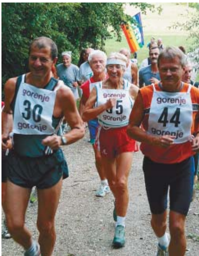
Tretji tek norveško-slovenskega prijateljstva v Podkrajju pri Velenju je lepo uspel.