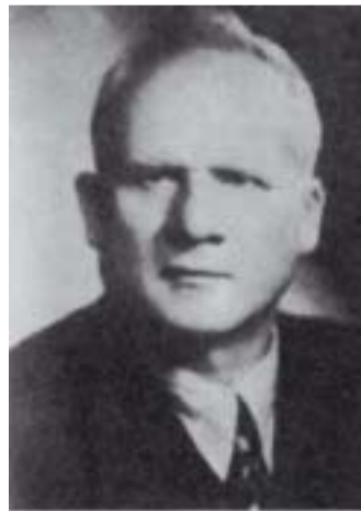
Prežihovega Voranca (1893–1950)

lejno leto obeležili na celo vrsto načinov. Med drugim bodo oživili Vorančevo pot, ki naj bi postala šolska učna pot, občina Ravne na Koroškem bo odkupila rokopise Prežihovega Voranca, ki jih hrani njegova vnukinja, in jih predala Koroški osrednji knjižnici dr. Franca Sušnika, kjer spomin na pisatelja že vrsto let ohranjajo s spominsko sobo. Prav tako bo občina z odkupom večjega števila iz-