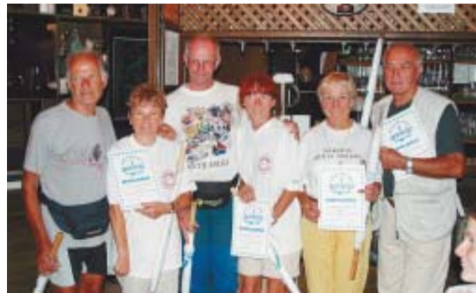
Zmagovalci v sestavi ženska - moški