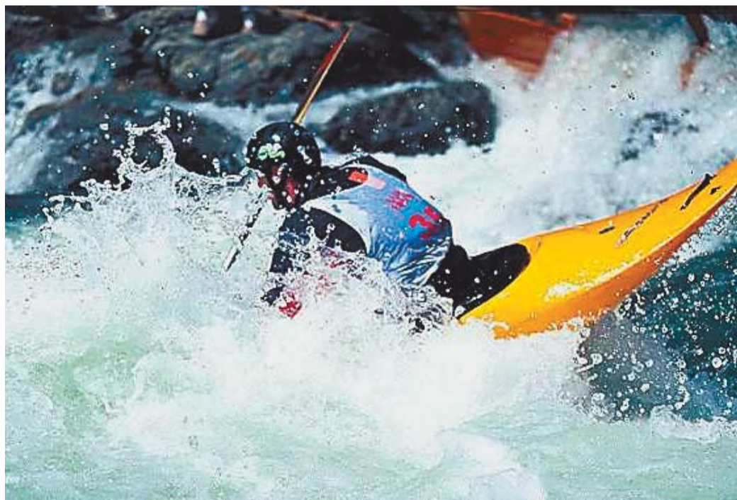
Bodo premagali savinjske brzice?

Mi pa računamo, da nas bodo imenovani poslanci seznanili, kako te stvari sedaj potekajo, ali in koliko bodo v njihovi akciji »SA-ŠA« pripomogli sklepi zainteresiranih občinskih svetov in ali bi katera od občin, katere občinski svet ne bi bil zainteresiran, vseeno postala del pokrajine Saša?