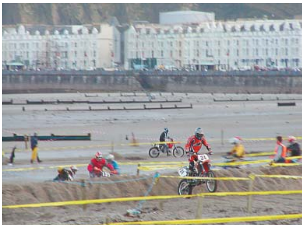
Motokros proga na glavni plaži