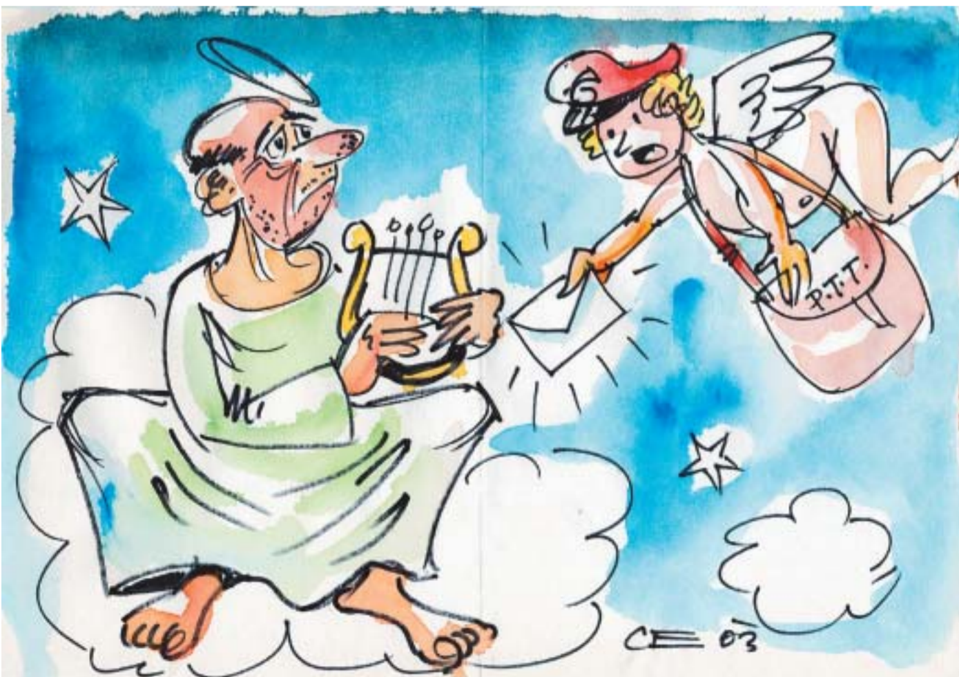
No, gospod Novak, končno je le prispelo vaše vabilo na specialistični pregled!