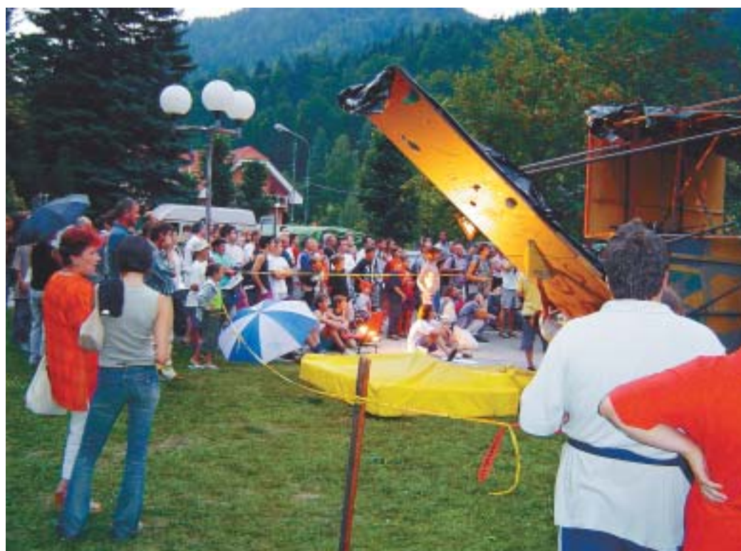
Tekma je privabila veliko gledalcev.