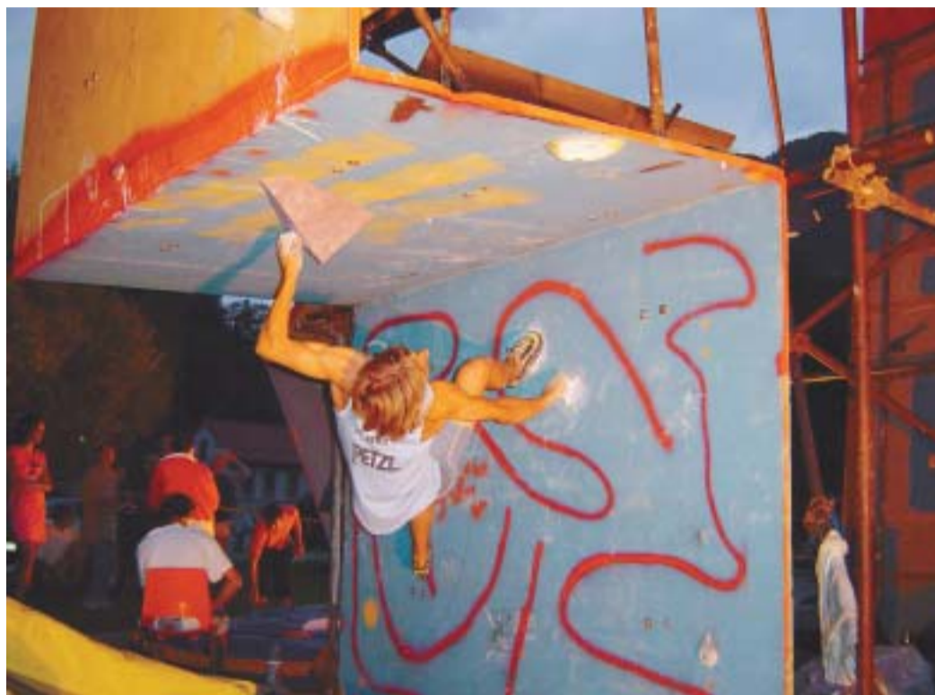
Balvan t.3 je povzrpal največ problemov.