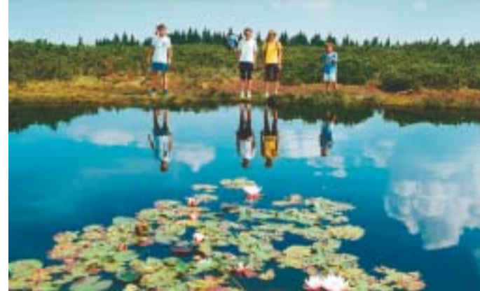
Pot do Lovrenških jezer je slikovita, trud pa je poplačan z vodnim ogledalom vrtom lokvanjev.

Na Pohorju srečaš prijazne ljudi, planinske zanesenjake, kornjake, kmete, ki skrbno zbirajo krmo za zimo vsevprek po travnatih planotah, v bližini Rogla tudi moteče traktorje, športnike in še vedno dovolj polna barja Črnega jezera, lovrenških lepotic s črnim lokvanjem in Ribniškega jezera. Toda s seboj je potrebno poleg