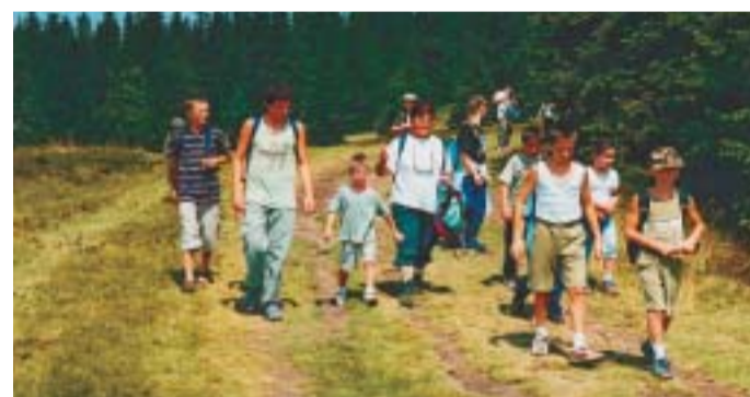
Cele družine na zdravih poteh preko Pohorja.

malice nositi dovolj vode ali čaja, saj so pohorski studenci večinoma presahnil, v kočah pa so cene zasoljene.