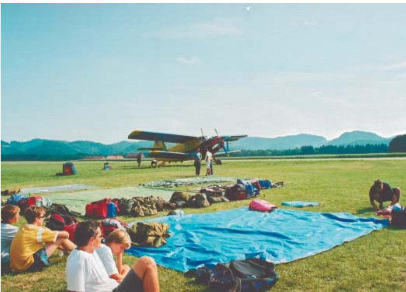
Aero - expo 2003 in lepo vreme, sta privabila množice obiskovalcev. (Stran 4)