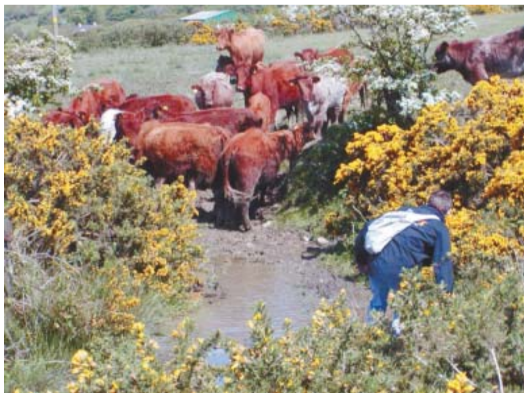
Dostop do proge je bil zelo zanimiv