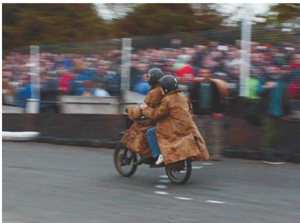
Purple Helmets – akrobatsko-humorističen nastop