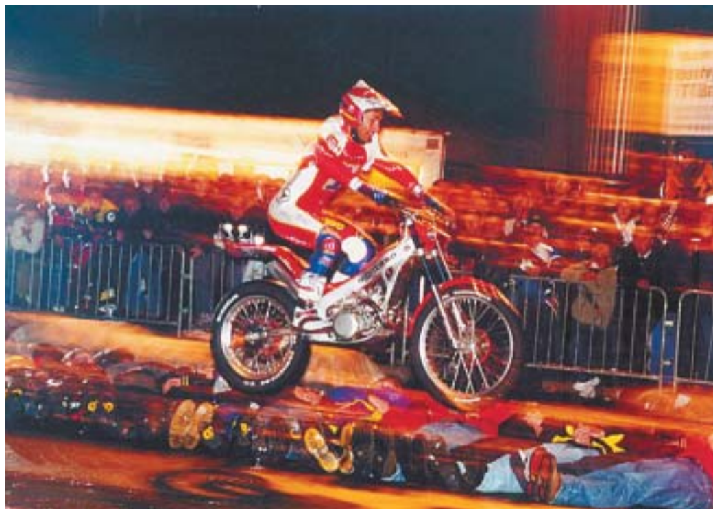
Trial šampioni zabavajo obiskovalce na promenadi