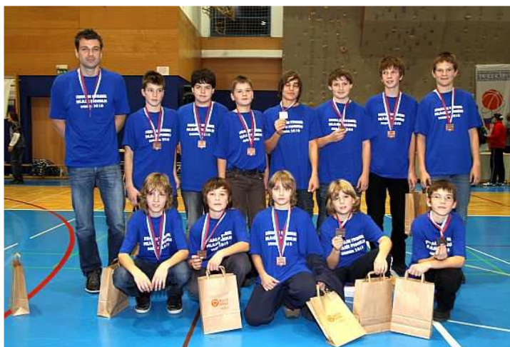
Ekipa Mlajših pionirjev U12 – 3. mesto v Sloveniji