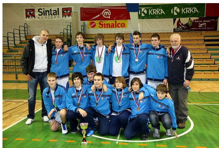
Ekipa Starejših pionirjev U14 – 3. mesto v Sloveniji