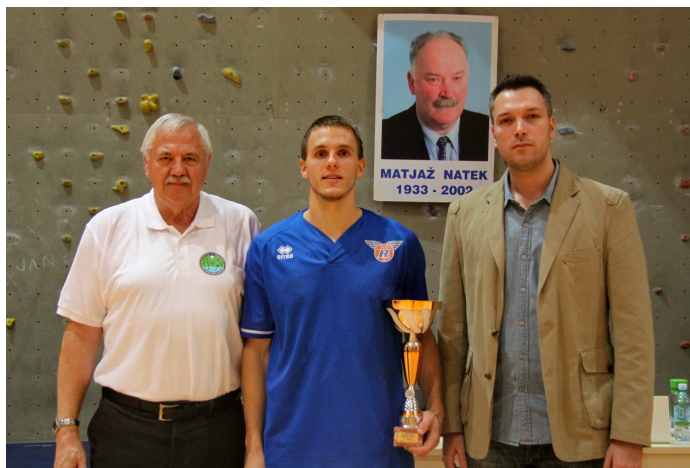
10. Memorial Matjaža Natka