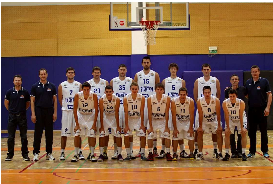
Članska ekipa KK Elektra Šoštanj v sezoni 2013/14